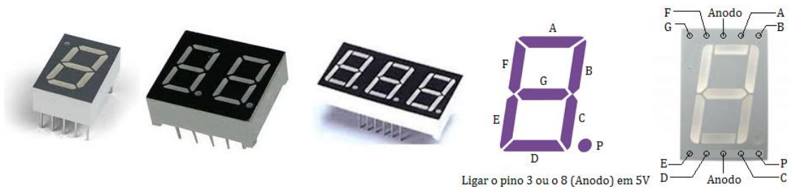
Figura 3 – Exemplos de mostradores (em inglês displays ) de 7 segmentos e sua nomenclatura.

Displays de 7 segmentos podem ser encontrados em diversos tamanhos, cores e número de dígitos. O aspecto físico dos displays de 7 segmentos é exemplificado na Figura 3 dada a seguir, onde está feita a indicação do nome de cada segmento e sua localização.